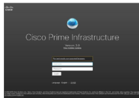
図 2. Cisco Prime Infrastructure